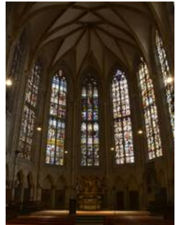
Chor im Münster zu Ulm (Konservierung)