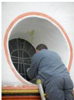
in situ Reparatur eines Kirchenfensters