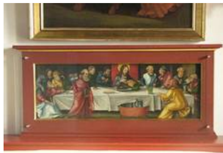
UV++Schutzscheibe vor Bildtafel aus dem 16. Jahrhundert