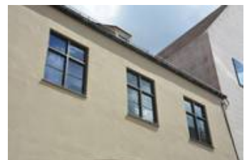
Luftbildarchiv des BLfD (UV++ & IR-Schutz)