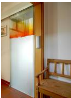
gestaltete elektrische Schiebetür