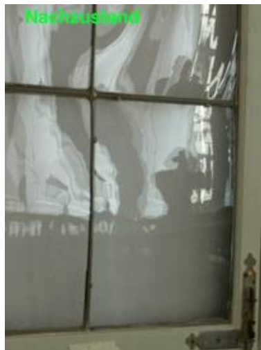
Im Nachzustand ist paßt sich die Ergänzung ideal dem historischen Bestand an.