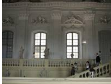
Links ist eines der Blindfenster zu sehen, die sich den Fenstern zum Innenhof anschließen.

Weitere Auskünfte erteilen wir gerne auf Anfrage .